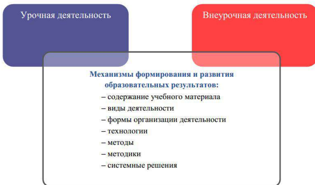
Рис. 7. Механизмы формирования и развития образовательных результатов

Механизмы формирования и развития образовательных результатов: способность их использовать в учебной, познавательной и социальной практике;